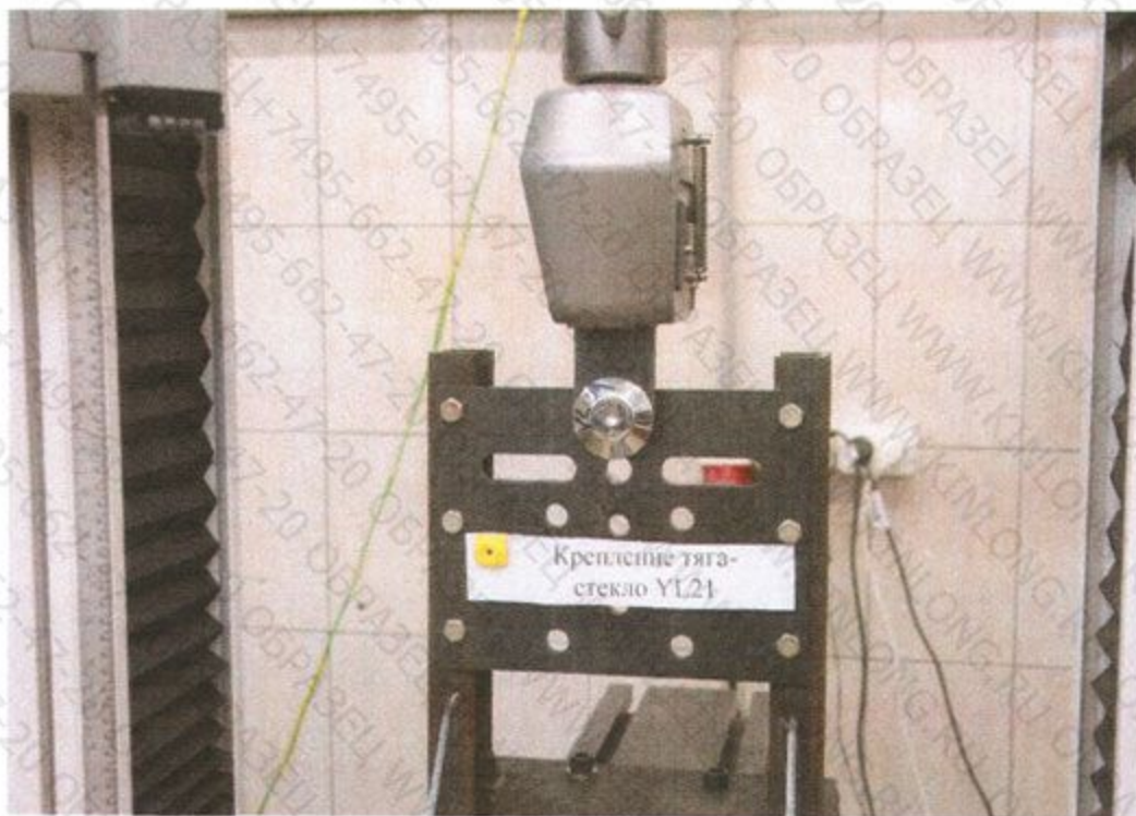
Рис. 6. Образец в процессе испытания. Схема нагружения ( F_y )