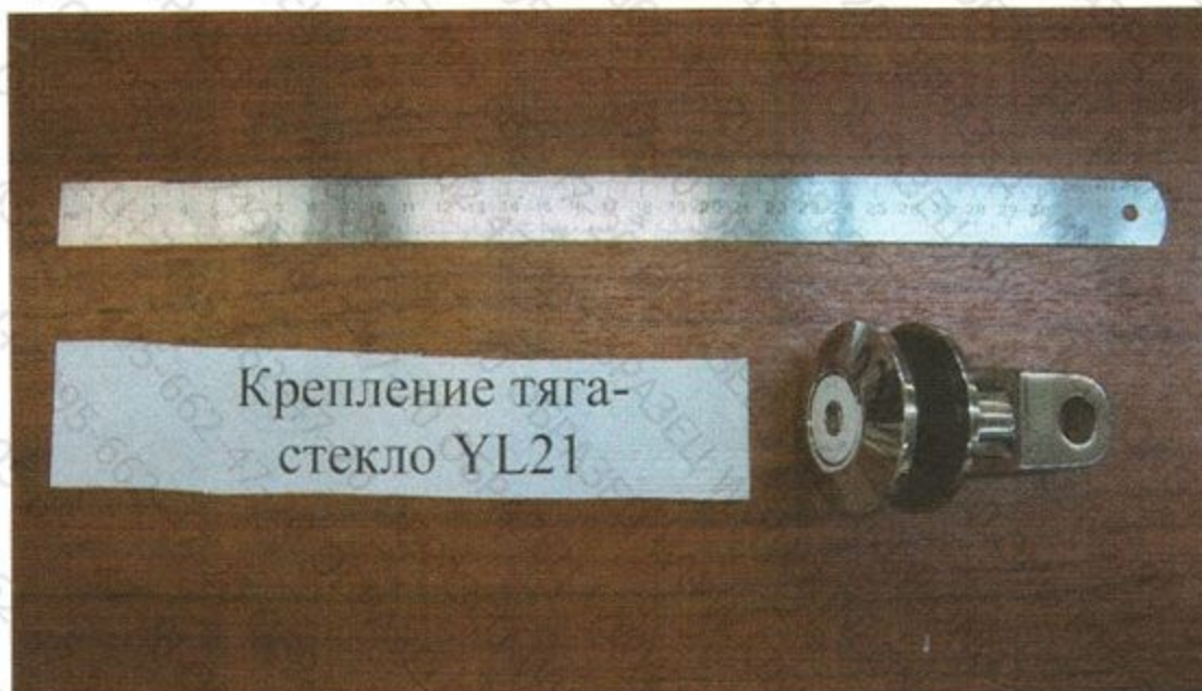
Рис. 3. Образец перед испытанием. Схема нагружения (F x )