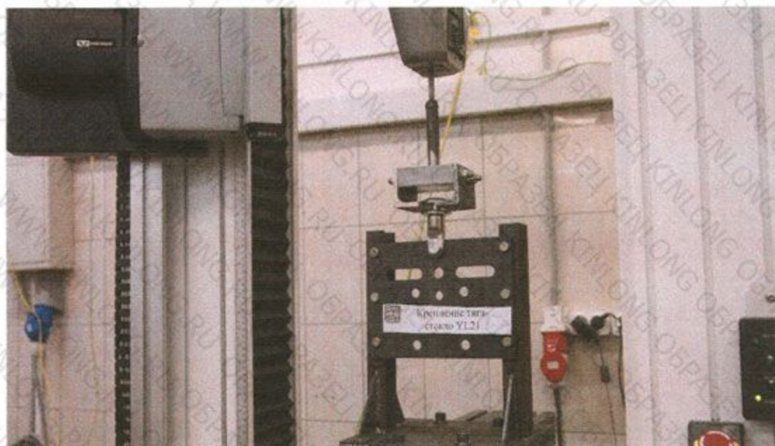
Рис. 4. Образец в процессе испытания. Схема нагружения (F x )