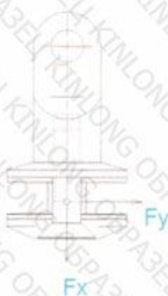
Рис. 1. Крепление тяга-стекло YL21. Схема нагружения.