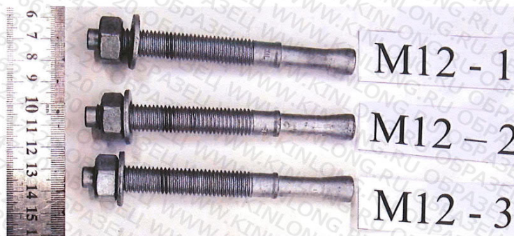
Рисунок 1. Образцы до испытания

Согласно ГОСТ ISO 898-1-2014 для болтов класса прочности 8.8 требуемый предел прочности на растяжение – R_m=800 МПа. Следовательно, испытанные образцы по указанной характеристике соответствуют классу прочности 8.8.