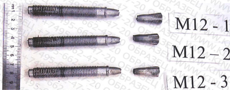
Рисунок 3. Образцы после испытания