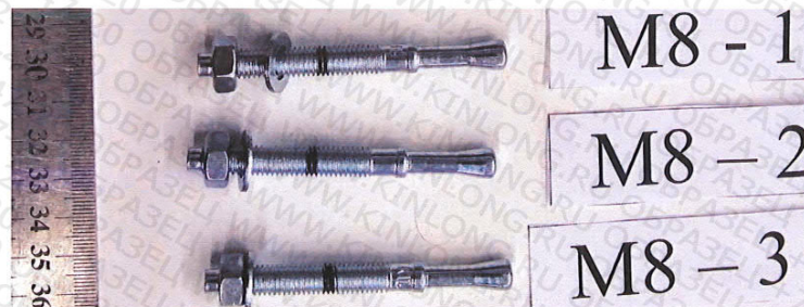
Рисунок 1. Образцы до испытания

Согласно ГОСТ ISO 898-1-2014 для болтов класса прочности 5.8 требуемый предел прочности на растяжение – R_m=520 МПа. Следовательно, испытанные образцы по указанной характеристике соответствуют классу прочности 5.8.