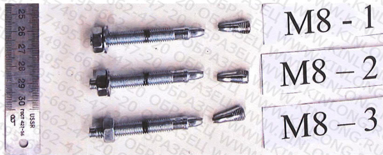
Рисунок 3. Образцы после испытания